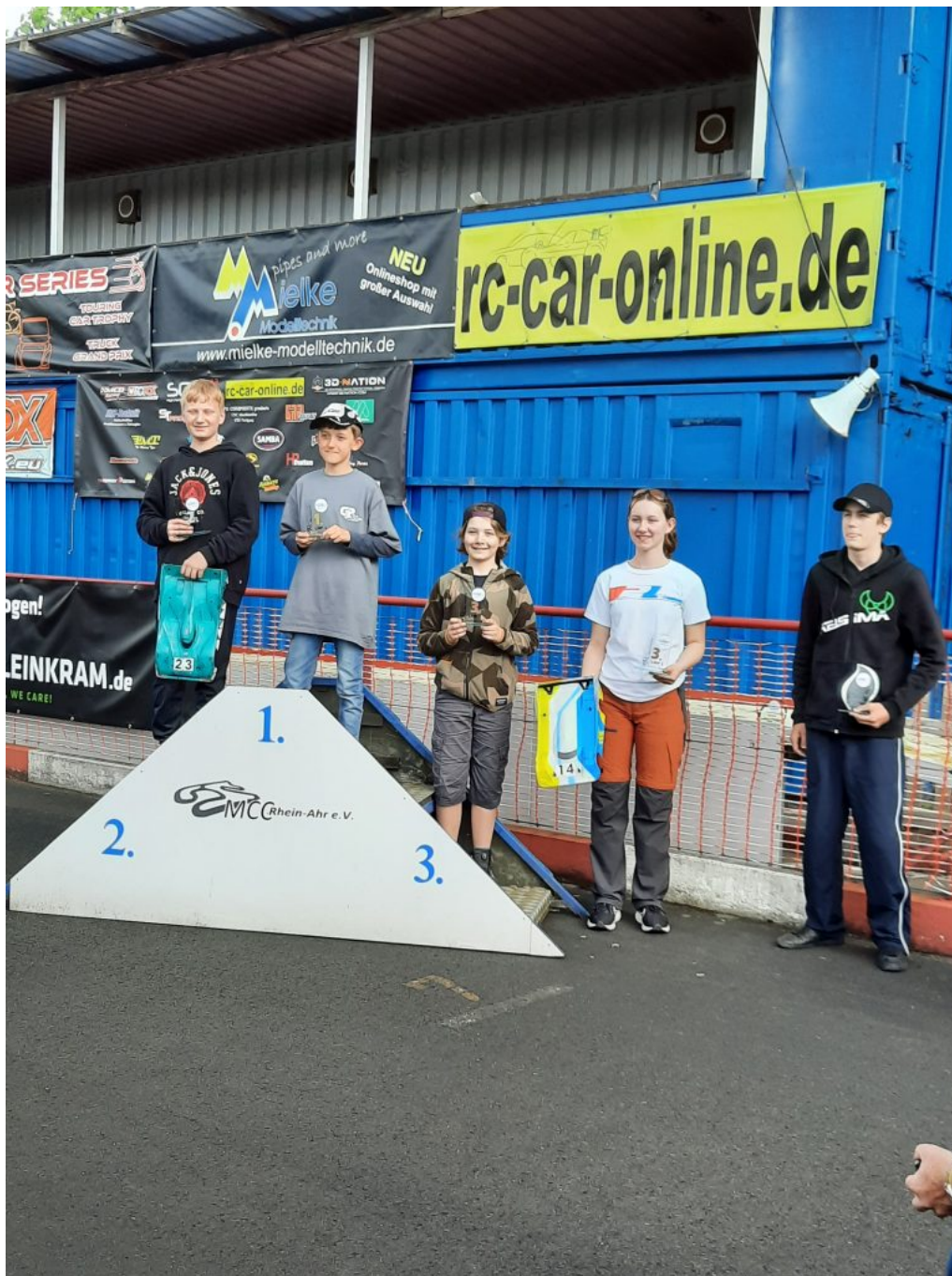
Unsere ambitionierten Jugendlichen Fahrer in der LMP2 Stock