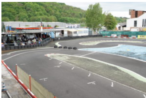
Anfang kurze Gerade