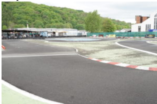
Ende kurze Gerade