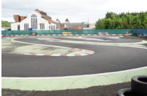
1. Spitzkehre und Schikane