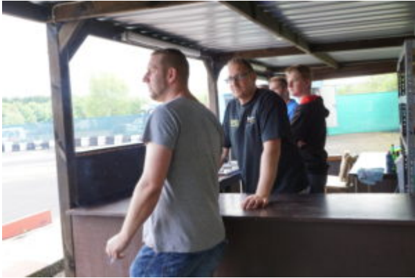
Vereinsmitglieder in der TA