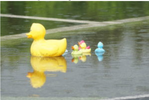
Teich auf der Strecke (Sonntag)